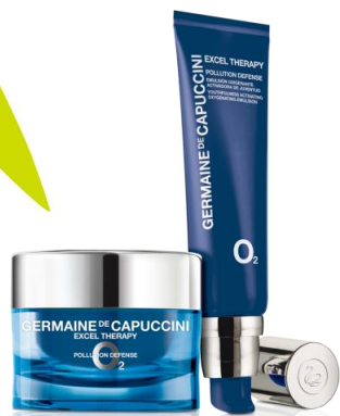
EXCEL THERAPY O2 POLLUTION DEFENSE

Elige el tratamiento Timexpert que mejor se adecúe a tu piel