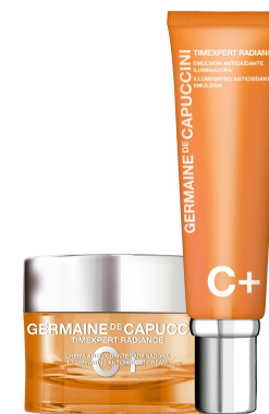
TIMEXPERT RADIANCE C+